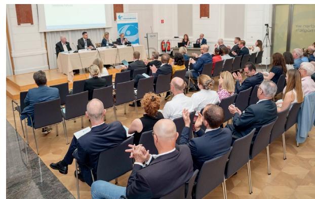
(© Sebastian Hochleitner)

Die Mitgliederversammlung bot damit nicht nur Raum für Rückblick und organisatorische Entscheidungen, sondern unterstrich auch die Kontinuität und das gemeinsame Engagement der Mitglieder für die Arbeit von Transparency International Austria. Zum Abschluss der Mitgliederversammlung nutzten die anwesenden Mitglieder den Rahmen für einen informellen Austausch. Dabei standen Gespräche über die zukünftige Arbeit von TI-Austria sowie der persönliche Dialog im Vordergrund. Ein besonderer Dank gilt allen Mitgliedern für ihr Engagement und ihre Unterstützung.