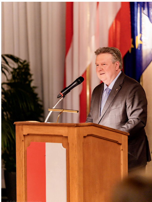
Bürgermeister Dr. Michael Ludwig