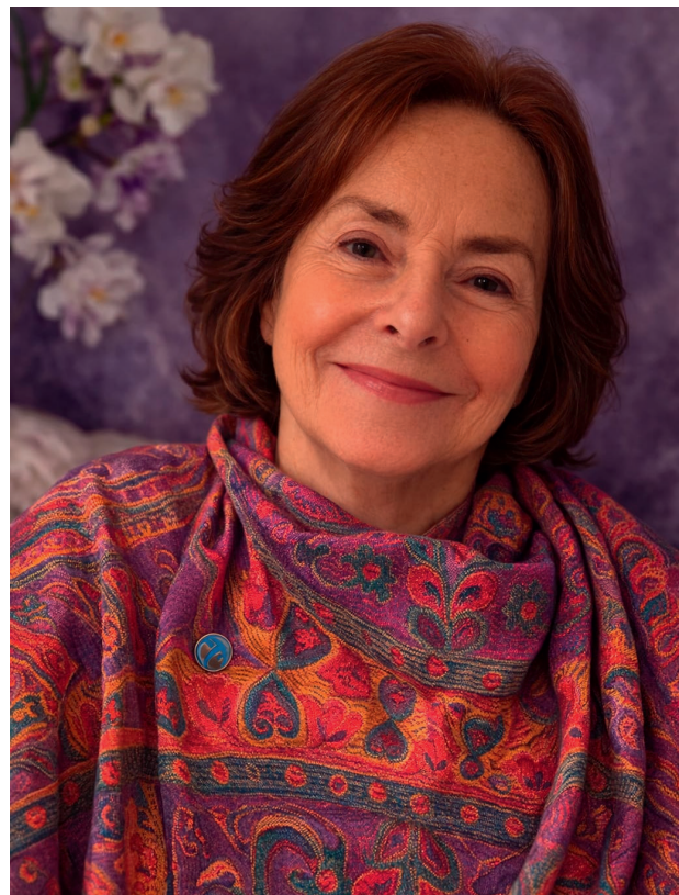
Prof. in Eva Geiblinger

Die Jubiläumsfeier war Anerkennung für zwei Jahrzehnte Ausdauer und zivilgesellschaftliches Engagement. Zugleich war es ein klarer Auftrag, den Einsatz für Transparenz, Integrität und demokratische Kontrolle auch in Zukunft entschlossen fortzusetzen.