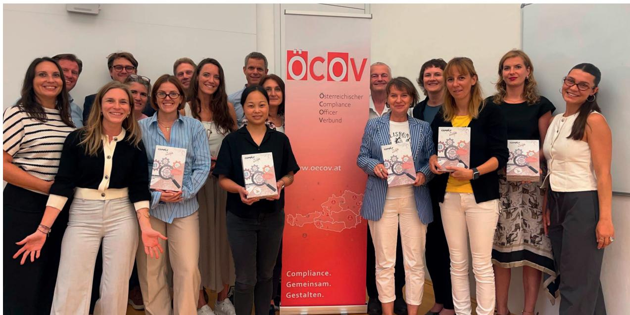
Teilnehmer:innen des Compliance Escape Game